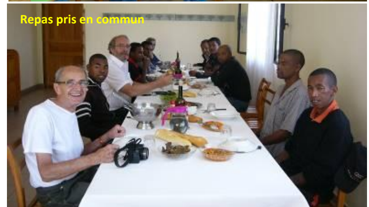
Repas pris en commun

L'objectif de cette mission a été atteint, il permettra d'augmenter les formations qui y sont actuellement dispensées et, de ce fait, augmenter le nombre de jeunes défavorisés pris en charge et sortants de l'établissement avec un métier.