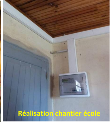
Réalisation chantier école