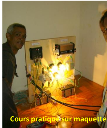
Cours pratique sur maquette

Le sujet du chantier école était de rénover et compléter l'éclairage d'un bâtiment de sanitaires, toilettes et douches, pour filles et garçons. Séparés en deux groupes de 5 pour effectuer les travaux sur chacune des 2 parties Filles et Garçons, les stagiaires ont montré une bonne capacité à s'organiser, gérer le dépannage et la qualité de leur installation.