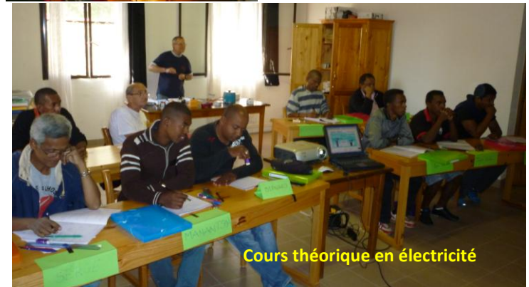
Cours théorique en électricité