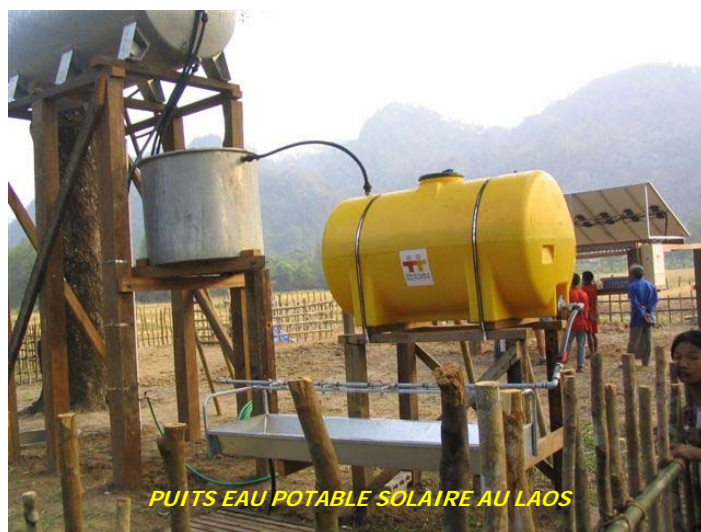
PUITS EAU POTABLE SOLAIRE AU LAOS