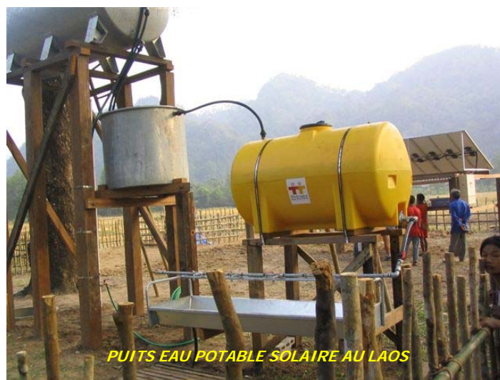
PUITS EAU POTABLE SOLAIRE AU LAOS