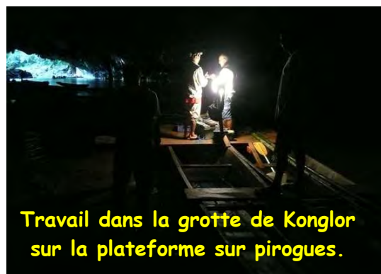
Travail dans la grotte de Konglor sur la plateforme sur pirogues.