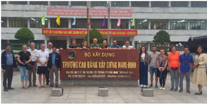
Đoàn đến thăm một trung tâm dạy nghề ở Nam Định

Tại Madagascar, đoàn đã đến thăm quan các dự án ESF thực hiện tại các làng Ambodiforaha và Ambanizana. Xuyên suốt chuyến đi, mọi người đều ghi nhớ cảm giác hòa mình vào các bản làng, những giây phút giao lưu cùng người dân địa phương được hưởng lợi từ dự án do hiệp hội thực hiện. Nơi đây xa mọi thứ và đặc biệt tránh các tuyến du lịch thông thường.