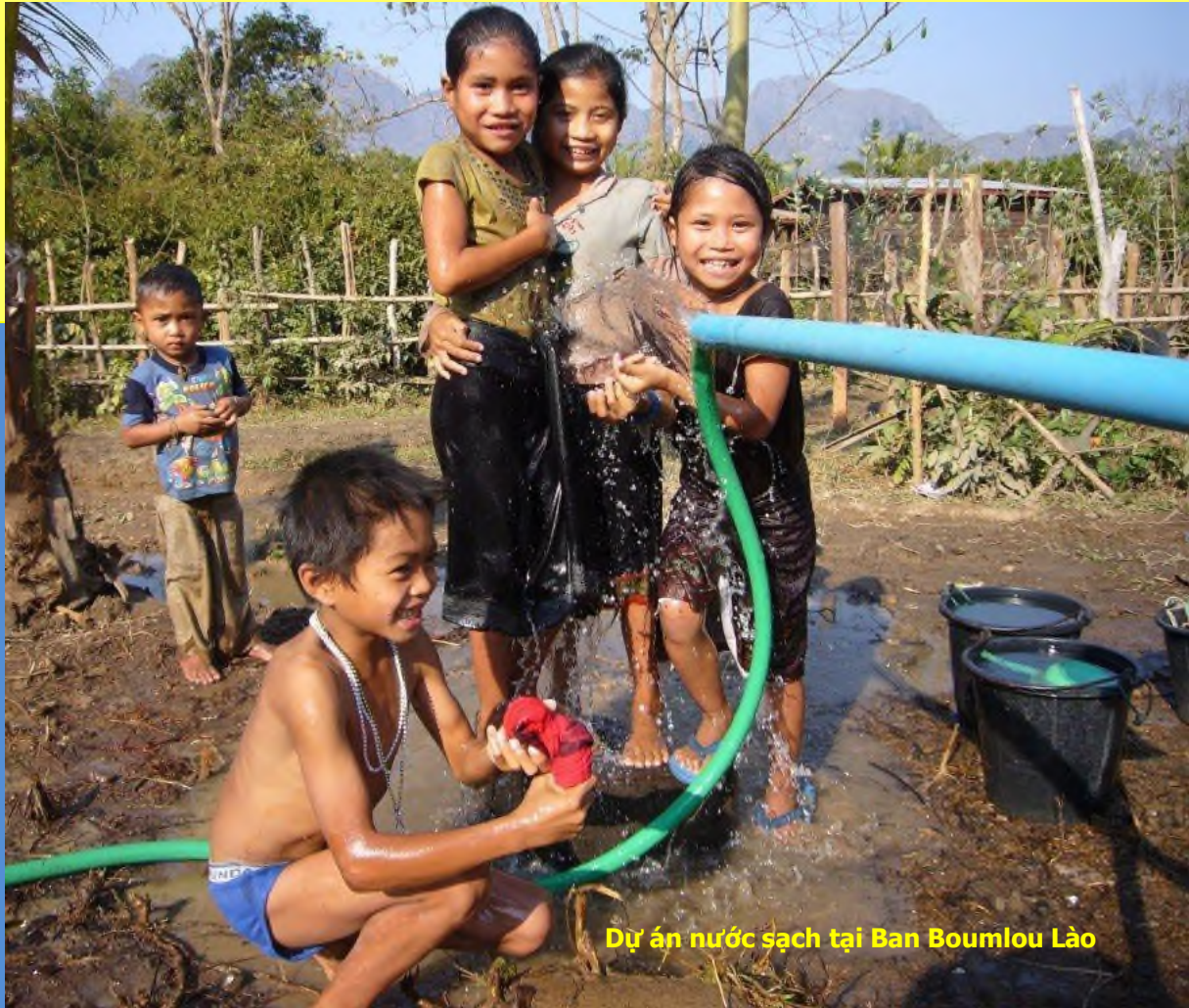
Dự án nước sạch tại Ban Boumlou Lào

Cung cấp điện, nước sạch và các chương trình đào tạo cho những nhóm cư dân khó khăn