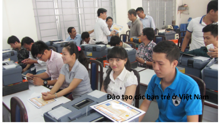
Đào tạo các bạn trẻ ở Việt Nam