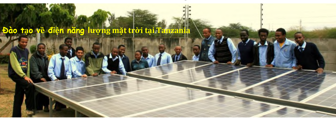
Đào tạo về điện năng lượng mặt trời tại Tanzania

Các dự án do ESF điều hành diễn ra trên toàn thế giới.