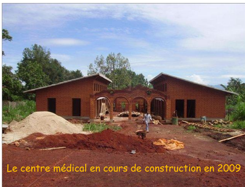
Le centre médical en cours de construction en 2009